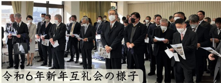
令和6年新年互礼会の様子

皆様、明けま しておめでとう ございませう。今 和6年、皆様と は輝かしい新年 をお迎えのこ と心よりお慶び 申し上げます。昨 申し上げます。昨 年からは、コロナ 禍から徐々動き 済みが回復の動 がみられまし た。一方で、円 安や原材料費高 騰など、中小企